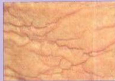
Pele de agricultor com foto-envelhecimento