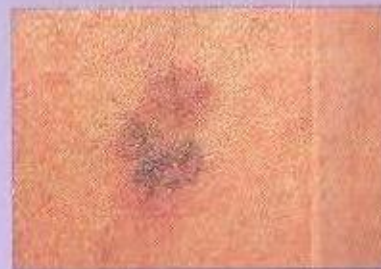
Queratoses Actínicas. Lesões pré-malignas