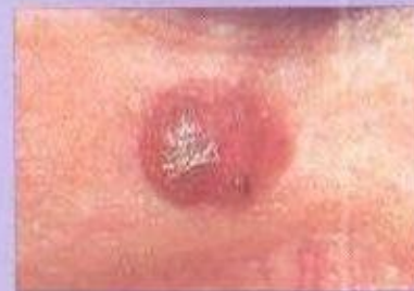
Carcinoma Baso-celular ou Basalioma