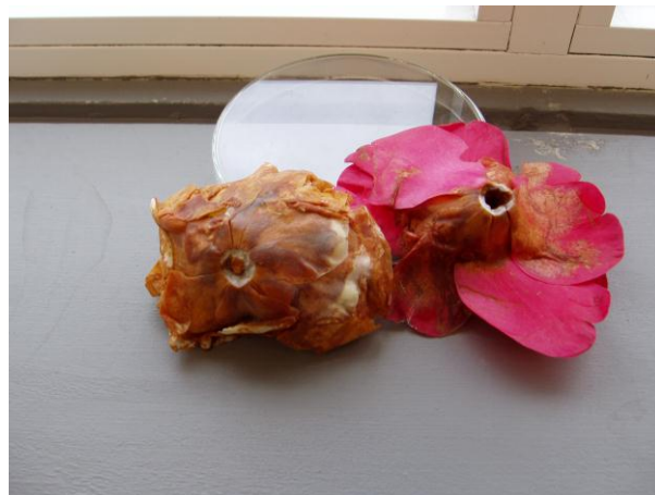
Sintomas do ataque do fungo em flores.

As flores atacadas podem manter-se aderentes à planta mas frequentemente caem sem se desmancharem.