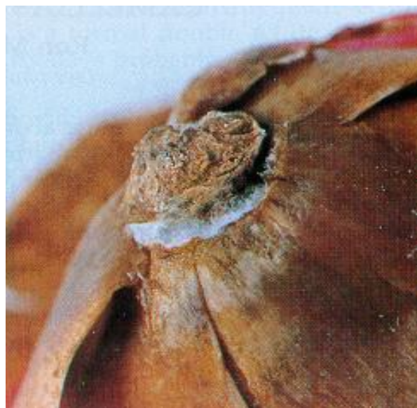
Pormenor do micélio do fungo

- Dentro da Comunidade as plantas destinadas à plantação devem circular com passaporte fitossanitário e a importação de países não europeus deve cumprir as exigências fitossanitárias em vigor. Para mais esclarecimentos deve contactar a Direcção de Serviços de Agricultura e Pecuária.