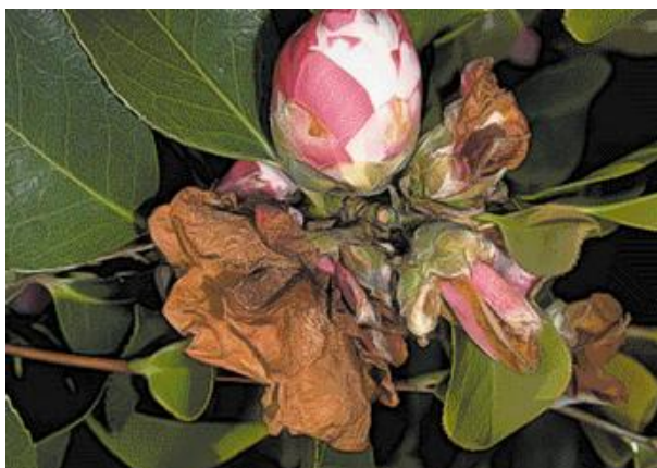
Sintomas do ataque do fungo em flores.

Este fungo afecta espécies do género Camellia – C. japonica , C. reticulata e C. sasanqua . Todas as cultivares e híbridos destas espécies parecem ser susceptíveis.