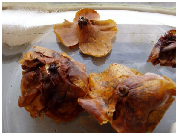
Sintomas do ataque do fungo em flores.

- Adquirir de preferência plantas sem flores e de raiz nua.