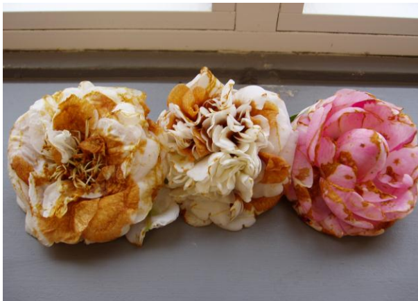
Sintomas do ataque do fungo em flores

Não existe nenhum método de controlo satisfatório pelo que se devem tomar algumas medidas preventivas: